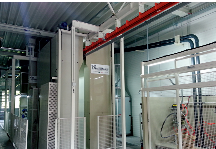
Die Automatiklackieranlage des italienischen Herstellers Vidali Impianti passt exakt auf die Anforderungen von Winkler.