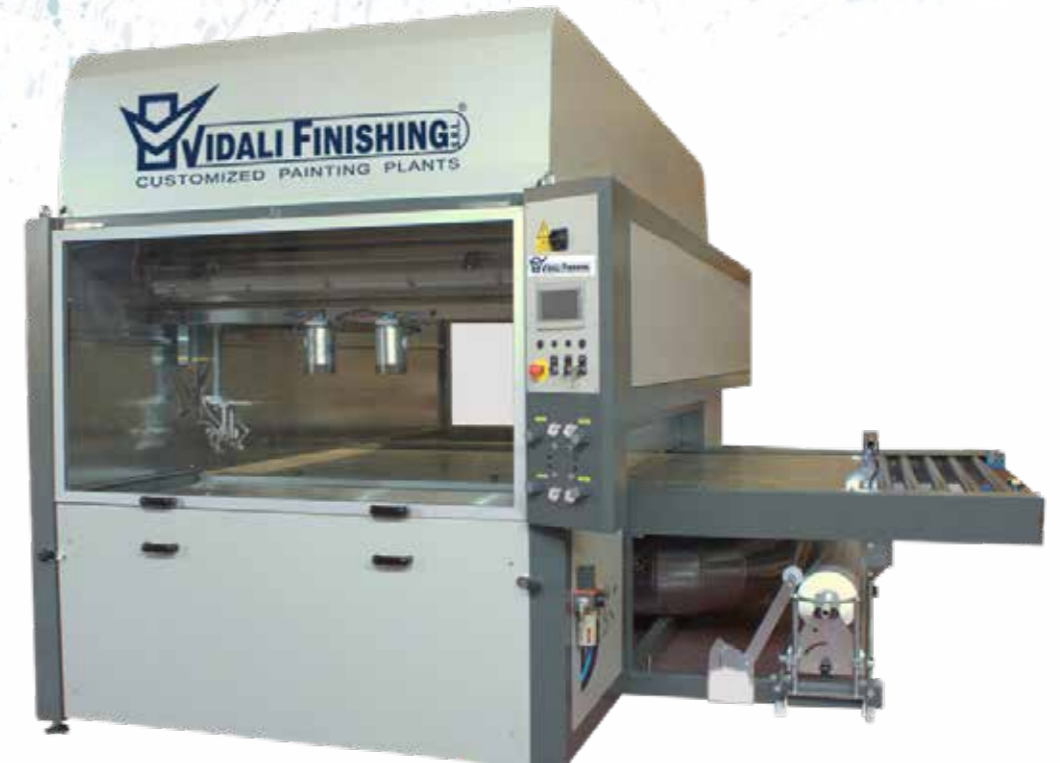
BARRIERA DI LETTURA IN INGRESSO