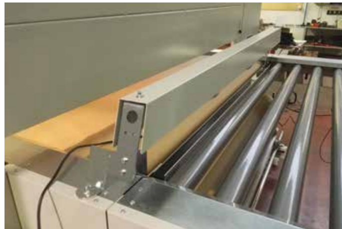
INPUT READING BARRIER БАРЬЕР СЧИТЫВАНИЯ ВХОДА