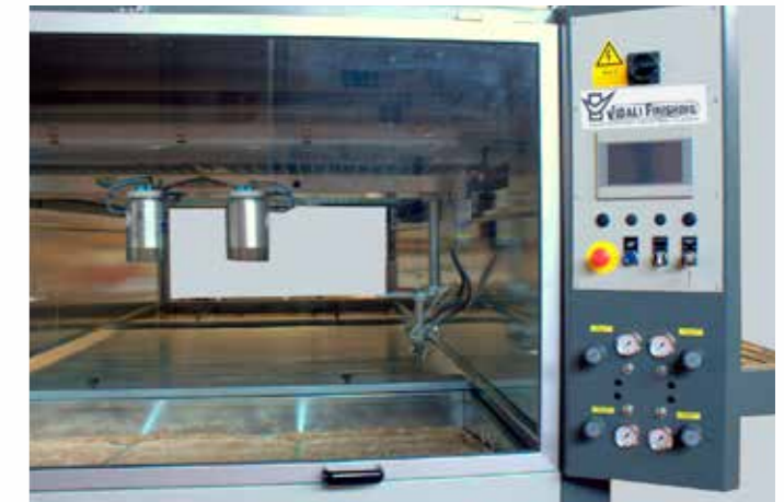
CONTROL PANEL ПАНЕЛЬ УПРАВЛЕНИЯ